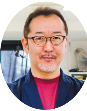
■講師 サイエンス作家 竹内 薫 (たけうち かおる)